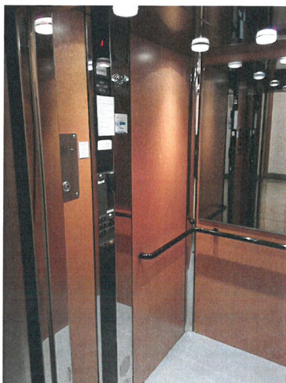
Pohled 1 do kabiny