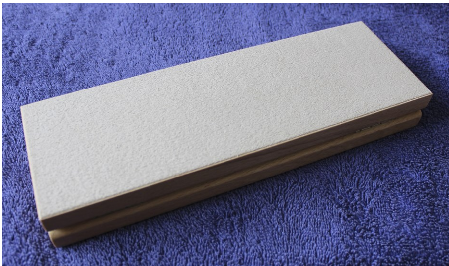
Obr. č. 5

Kartonová etuje bude vyrobena z pevného kartonu povahovaného odolným potahovacím papírem. Konkrétní odstín papíru stanoví odběratel na základě vzorkovníku předloženého dodavatelem. Na vnější straně víčka etujů bude u mincí/stříbrných odražků běžné i špičkové kvality v levém horním rohu umístěno třířádkové logo ČNB v barvě zlaté, aplikované ražbou přes fólii nebo jinou vhodnou technikou, konkrétní techniku provedení a barvu loga stanoví odběratel na základě vzorkovníku předloženého dodavatelem (obr. č. 6).