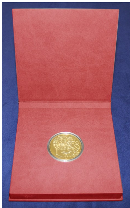
Obr. č. 7

Konečná podoba kapslí, etují a přebalu podléhá schválení odběratele.