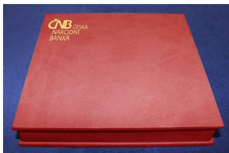
Obr. č. 6

Kartonová etuje bude vyrobena z pevného kartonu povahovaného odolným potahovacím papírem. Konkrétní odstín papíru stanoví odběratel na základě vzorkovníku předloženého dodavatelem. Na vnější straně víčka etujů bude u mincí/stříbrných odražků běžné i špičkové kvality v levém horním rohu umístěno třířádkové logo ČNB v barvě zlaté, aplikované ražbou přes fólii nebo jinou vhodnou technikou, konkrétní techniku provedení a barvu loga stanoví odběratel na základě vzorkovníku předloženého dodavatelem (obr. č. 6).